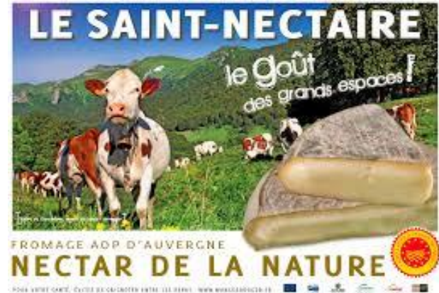
Fabrication du Saint-Nectaire