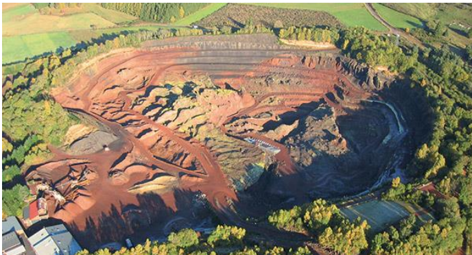
Volcan de Lemptegy