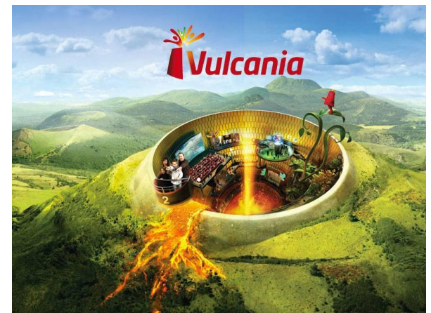
Parc d'attraction VULCANIA