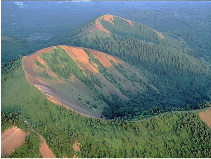
Chaîne des Puys de Dôme